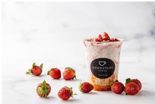
こたつ会議オリジナルスイーツ

「こたつ会議」は、時代を動かすオピニオンリーダーたちが日本の伝統的な会話のプラットフォームである「こたつ」を囲んでさまざまなテーマを通じて語り合うトークイベントです。