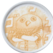
河了紹 (かりょうてん)