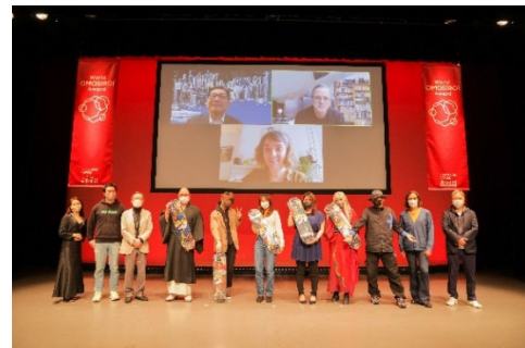
World OMOSIROI Award 8th 授賞式

「World OMOSIROI Award」は、ナレッジキャピタルのコアバリューである「OMOSIROI」の価値を世界に発信することを目的として、ナレッジキャピタルと関わりのある有識者に推薦された人の中から、未来を面白くする「OMOSIROI」を体現する「人」を選出するアワードです。