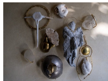
O'Tru no Trus 作品例