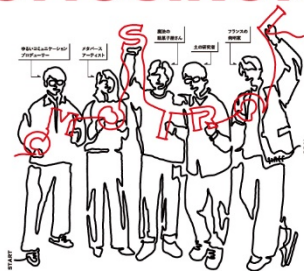
メインビジュアル