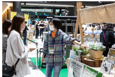
過去開催時の様子

日本経済の中核とも言えるモノづくり産業に再び注目が集まり、特に2025年大阪・関西万博を控える関西では行政や産業界からも高い関心が寄せられています。ナレッジキャピタルではその動きを応援するため、新たなモノづくりイベントとして「KNOWLEDGE CAPITAL OPEN FACTORY」を開催します。