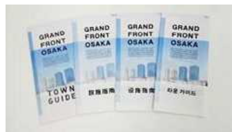
タウンガイド冊子