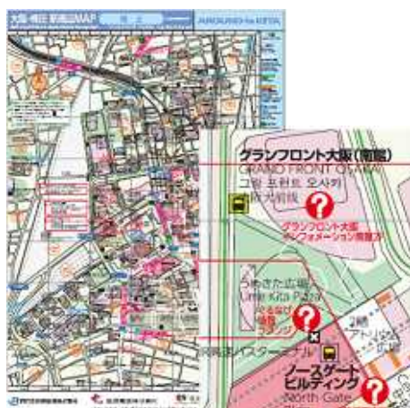
「大阪・梅田 駅周辺 MAP」