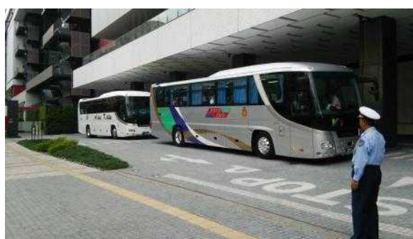
インセンティブツアーの様子(北館1階車寄せ)