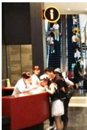
インフォメーションでの対応の様子