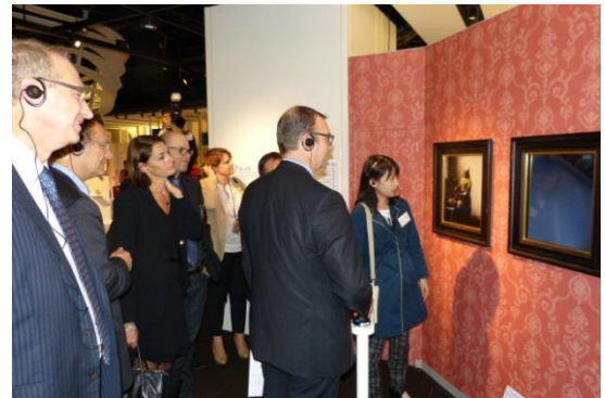
ナレッジキャピタル「The Lab.」を視察される御一行団

海外の各機関との連携構築による「国際交流」の実現を目指すナレッジキャピタルは、フランスで2番目の経済主要都市であるリヨン市と開業前から交流を深めてきました。