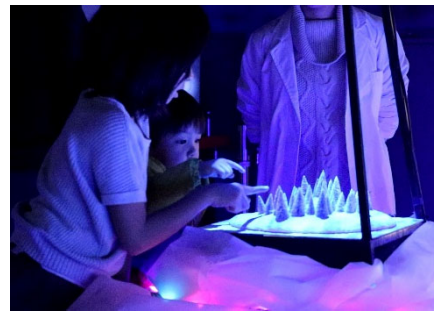
エア・フローティング・メディア参考作品

今回は、生きるための食ではなく、楽しむための食を空中映像で表現し、「未来の食のかたち」を体験できるブースを出展します。具体的には、海が好きな人にとってはより食を楽しめるであろう海の中での食事シーンをエア・フローティング・メディアで再現します。コップや皿の上にクラゲやクリオネを立体的に浮遊させた作品で、ワクワクする食の空間・体験を提案します。