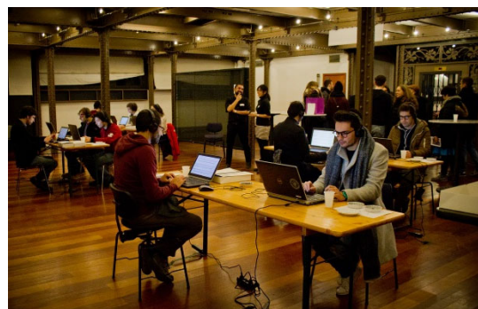
音と味覚の実証実験

このたび、連携の目的の一つである芸術分野と先端技術の融合によるイノベーション創出の一環として出展します。ACI が提供する研究者やアーティストと共に現地に滞在し、交流しながら創作活動を行うレジデンスプログラムに招待を受け、実現したものです。日本からの出展者は、ナレッジキャピタルが推薦したエアフローティングメディア委員会と東京大学大学院情報理工学系研究科 廣瀬・葛岡・鳴海研究室の 2 者です。ブースは、フェスティバル開催期間 6 月 22 日 (土) ～6 月 28 日 (金) の後も、8 月 4 日 (日) まで現地で展示します。