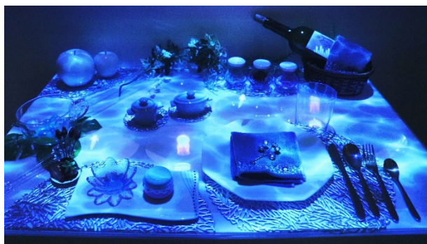
空中浮遊映像で未来の楽しむ食を提案

一般社団法人ナレッジキャピタルならびに株式会社 KMO は、MOU (相互連携に関する覚書) を締結している韓国の準政府機関「アジア文化院」(以下、ACI) とのイノベーション創出の一環として、国際的な未来技術フォーラム「ACT フェスティバル 2019」に、ナレッジキャピタルが推薦する 2 組の参画者の先端技術ブースを出展しますのでお知らせします。