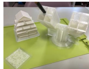
3D プリンター作品イメージ

本講座は、ジュニアドクター育成塾の事業であるめばえ適塾とのコラボレーション講義です。パソコン、タブレットを駆使して3Dデータを作成し、3Dプリンターで印刷するまでの一連の工程を全6回の連続講義を通じて実践的に学びます。