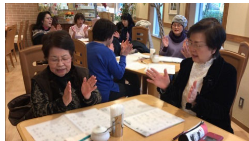
タップネス利用イメージ

タップネスは、音楽に合わせて手指をグー・パーさせたり、表示される数字に合わせてピアノを弾くように指をタップしたりすることで、座ったままの姿勢でも気軽に行える高齢者向けの脳活エクササイズです。