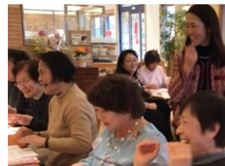
タップネスレッスンの様子

「脳の大半を活性化」させる効果があり、懐かしい記憶を想起するメンタル・タイムトラベル効果・認知症予防・脳力増強・ストレス解消などの大きな効果が得られるといわれています。