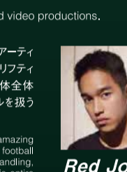
Red Joker レッドジョーカー